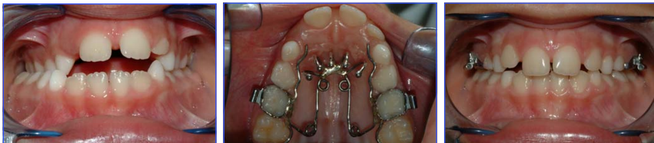
Figs. 5-6-7 cross-bite monolaterale destro con laterodeviazione funzionale con open-bite conseguente ad abitudine alla suzione del dito corretto con quad helix con griglia

(Figs 8-9-10). Se il cross-bite è invece legato a problematiche trasversali di tipo funzionale, la terapia deve interessare non solo l'aspetto statico del problema, ma anche quello dinamico, mediante apparecchiature in grado di controllare la muscolatura periorale e/o linguale nella postura e nell'atto deglutitorio.