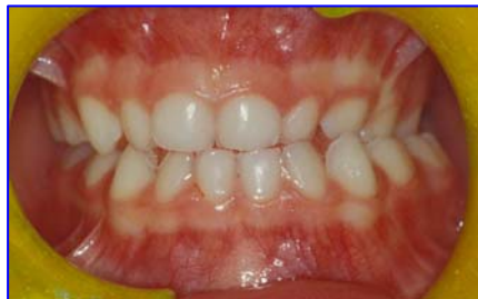
Cross bite posteriore con deviazione mandibolare