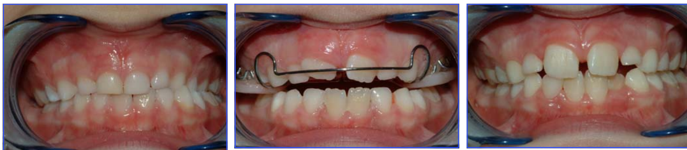
Figs. 2-3-4 cross-bite monolaterale sinistro corretto con placca rimovibile con vite centrale di espansione

Quando il cross-bite è legato a problematiche scheletriche, per un mascellare stretto o per una mandibola relativamente ampia, la risoluzione deve essere affidata alla espansione rapida della sutura medio palatina, terapia ortopedica estremamente valida in dentizione mista per la risoluzione di discrepanze trasversali che, se non precocemente intercettate e corrette, possono portare all'instaurarsi di laterodeviazioni mandibolari funzionali e nel tempo a gravi danni a livello scheletrico e articolare