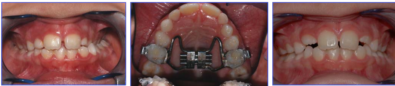
Figs. 8-9-10 cross.bite monolaterale sinistro con deficit trasversale del mascellare corretto con espansione rapida della sutura medio palatina

(Figs 8-9-10). Se il cross-bite è invece legato a problematiche trasversali di tipo funzionale, la terapia deve interessare non solo l'aspetto statico del problema, ma anche quello dinamico, mediante apparecchiature in grado di controllare la muscolatura periorale e/o linguale nella postura e nell'atto deglutitorio.