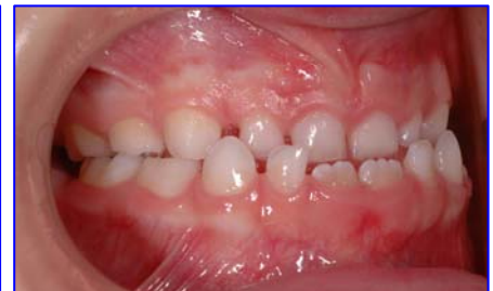
Cross bite anteriore

Il morso crociato può essere provocato solamente da una anomalia dentale; è presente quindi solo un'anomala inclinazione degli elementi dentali; oppure da contatti dentali anomali (precontatti) che determinano una deviazione mandibolare conseguente, si parla allora di morso crociato funzionale. Spesso è il risultato di una contrazione scheletrica dell'arcata superiore legata ad squilibri muscolari tra la lingua e la muscolatura periorale (labbra e guance). La lingua esercita, con la sua funzione, una stimolazione molto importante per la crescita del palato. In casi di abitudine viziata quale respirazione orale o deglutizione atipica, la lingua assume spesso una postura bassa con insufficiente stimolazione del palato; il risultato sarà una contrazione trasversale del mascellare superiore, che si manifesta clinicamente con il morso crociato. Un'ulteriore complicanza legata al cross bite è la presenza concomitante di una deviazione mandibolare evidenziata clinicamente da una non coincidenza delle linee mediane incisive superiore ed inferiore. La deviazione mandibolare, se non corretta tempestivamente, può predisporre allo sviluppo di una asimmetria scheletrica della mandibola. Quindi il morso crociato con deviazione mandibolare rappresenta una indicazione assoluta per un intervento precoce.