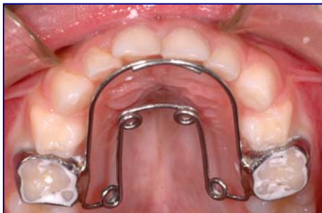
Dispositivo di espansione fisso

Il morso crociato può essere provocato solamente da una anomalia dentale; è presente quindi solo un'anomala inclinazione degli elementi dentali; oppure da contatti dentali anomali (precontatti) che determinano una deviazione mandibolare conseguente, si parla allora di morso crociato funzionale. Spesso è il risultato di una contrazione scheletrica dell'arcata superiore legata ad squilibri muscolari tra la lingua e la muscolatura periorale (labbra e guance). La lingua esercita, con la sua funzione, una stimolazione molto importante per la crescita del palato. In casi di abitudine viziata quale respirazione orale o deglutizione atipica, la lingua assume spesso una postura bassa con insufficiente stimolazione del palato; il risultato sarà una contrazione trasversale del mascellare superiore, che si manifesta clinicamente con il morso crociato. Un'ulteriore complicanza legata al cross bite è la presenza concomitante di una deviazione mandibolare evidenziata clinicamente da una non coincidenza delle linee mediane incisive superiore ed inferiore. La deviazione mandibolare, se non corretta tempestivamente, può predisporre allo sviluppo di una asimmetria scheletrica della mandibola. Quindi il morso crociato con deviazione mandibolare rappresenta una indicazione assoluta per un intervento precoce.