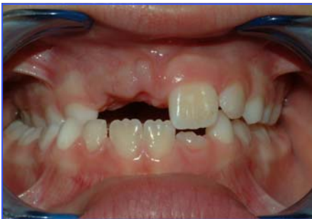
Fig. 1 cross-bite monolaterale destro

Le cause più frequenti sono l' ereditarietà che, come per altre patologie, gioca senza dubbio un ruolo universalmente riconosciuto; anche le alterazioni congenite , come ad esempio la labio-palatoschisi, sono fattori particolarmente rilevanti. Infine i disturbi del metabolismo, le infezioni o i traumi possono causare ipoplasia o arresto della crescita dei mascellari e dell'articolazione temporo-mandibolare.