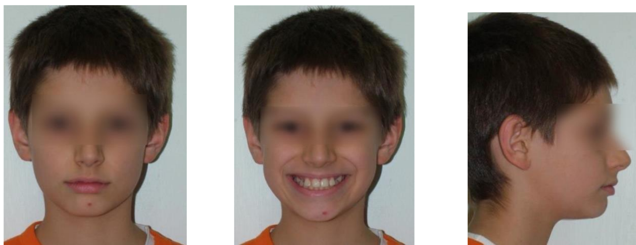
Foto del sorriso: il paziente deve guardare in direzione dell'obiettivo; il piano di riferimento orizzontale è la linea interpupillare. Solo la testa e l'inizio delle spalle del paziente devono essere visibili. Il paziente deve sorridere in modo naturale.

Foto Frontale: il paziente deve guardare in direzione dell'obiettivo; il piano di riferimento orizzontale è la linea interpupillare. Solo la testa e l'inizio delle spalle del paziente devono essere visibili. Le labbra devono essere in posizione di riposo.